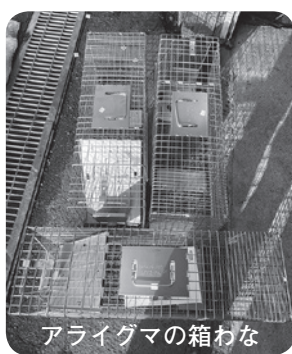
アライグマの箱わな