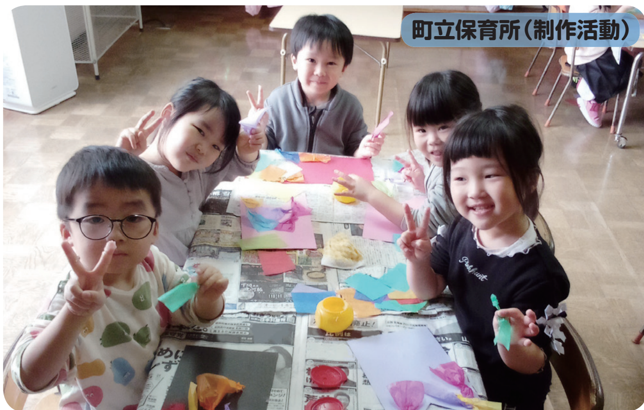
町立保育所(制作活動)