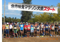
▲昨年のスタート風景

今年で35回目を迎える「余市味覚マラソン大会」は、全国各地から約1300名のランナーが参加して開催されます。 ハーフマラソンと10kmは、陸上競技場から美園町・山田町を経て豊丘町折り返し、5kmは山田町折り返しで、再び陸上競技場に戻るコースになっています。遠来のランナーの皆さんへの応援をお願いします。