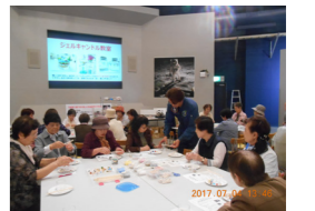
▲キャンドル製作風景

7月4日(火)、女性学級第5回学習講座「町内施設(余市宇宙記念館～スペース童夢～)見学・実習」が行われ、28名の学級生が参加しました。 実習として取り組んだ「ジェルキャンドル作り」では、職員から作り方の説明をうけ、短時間で素敵な作品ができました。 ジェル状のろうそくが固まるまでの時間を利用して、館内の見学も行いました。