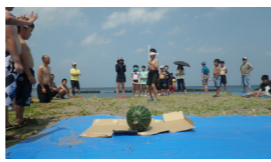
▲スイカ割りゲーム

教育委員会が主催しているウィークエンドサークル活動の第1回目の事業として「海水浴と地引網体験」が7月15日(土)にモイレ浜中海水浴場で行われました。 午前中はボランティアの方と一緒に海水浴を行い、お昼の「浜鍋」を食べた後は、スイカ割りなどのレクリエーションや普段体験することのない地引網をみんなで引き、楽しむことができました。 次回の「ムーブメント体験活動」は、10月1日(日)に中央公民館で行われます。