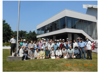
▲近代美術館で記念撮影

7月13日(木)、寿大学恒例の町外視察研修旅行を実施し、公民館の職員を含めて43名が参加しました。 午前中の「北海道立近代美術館」では、鑑賞前に美術館スタッフからの説明を聞き、「近美コレクション名品選」を自由に鑑賞しました。 昼食は、札幌市内のホテルでランチブッフェ。バラエティ豊かな料理を味わいました。昼食後は、石狩市の「パールライス工場」に向かい生産過程や「ごはんミュージアム」を見学しました。 日帰りの旅行でしたが、旅行を通して学生同士の交流を深めることもでき、楽しい学習講座となりました。