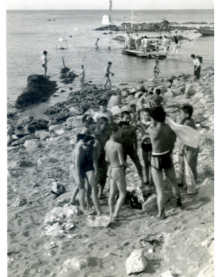
▲海で楽しむ子どもたち

今回の特別展では、駅・街・海・橋・道という町内のさまざまな場所を選んで、博物館が所蔵する今では見ることができなくなってしまう過去の余市の写真と現在の余市の写真を展示しています。 過去の写真を見ていると、いつも通っている道や橋、商店街などの今と変わった点だけでなく現在も変わらない点も多く発見できます。古い写真の中に知っている名前を見つけた時や、見たことのある建物や道路の形を発見すると、何だか嬉しい気持ちになります。 是非皆様にも写真のなかに散りばめられたヒントをもとに、この写真はどこなのかと探してみたいと思います。また、現在の写真との比較や、この写真の場所でこんな思い出があったと記憶の旅に出るなど楽しみ方は人それぞれ、過去と今とのつながりを発見し、多くを感じて頂ければと思います。 余市町に来て日が浅い方から長い間住んでいる方まで、皆様に楽しんで頂ける展示となっておりますので、多くの皆様のご来館をお待ちしております。