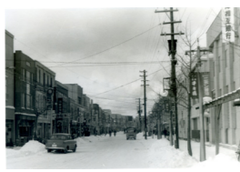
▲昭和36年の黒川商店街

料金 10月9日(月・祝)まで (休館日は毎週月曜日と祝日の翌日) 水産博物館1階特別展会場 通常の入館料でご覧いただけます。 (大人300円、小中学生100円) ※20名以上団体2割引