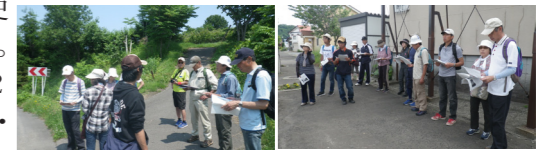
▲沢町遺跡付近にて ▲美園墓地付近にて

学芸員のガイドで町内の歴史を巡る公民館文化教室「歴史ウォーキング」を7月に2回実施し、20名が参加しました。 1回目は沢町方面(ヌッチ川遺跡、今邸園、沢町遺跡)、2回目は美園町・黒川町方面(美園墓地、開村記念碑、駅前広場・噴水)を巡り、地元の新たな歴史を学ぶことができた教室となりました。