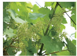
▲白く見えるのがブドウの花

とあるワイナリーの方から「ブドウの花が咲いてるから写真撮りに来たら」と誘われたことがきっかけで行くようになったブドウ畑の写真です。夏が過ぎ秋の収穫が終わって雪が降るまで、毎月のように通いました。去年一番多く撮影した場所の、最初の1枚として大切な写真でもあります。カラーで見るとブドウの葉の緑と青空のヌケ感、さわやかな夏を感じる1枚です。