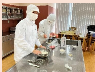
▼パンを作っている様子