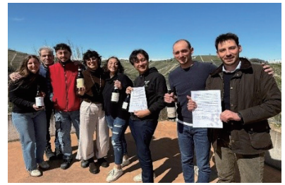
▲ 生産者連合の皆さんとの集合写真

今後、生産者同士の技術共有や子どもたちとの国際交流をはじめとして経済、教育、文化など幅広い分野で連携し、さらなる産地化と地域の魅力化を進めていきます。