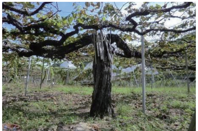
▲ 市天然記念物「竹原町の長寿ブドウ (キャンベル・アーリー種)」