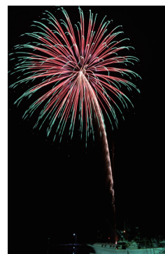
▲ 余市港で開催された第56回ソーラン祭り（2年前）の様子