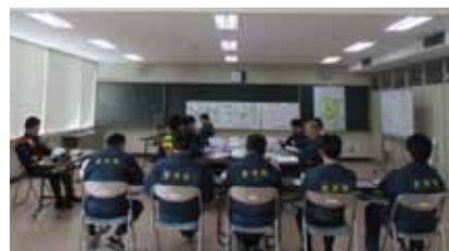
災害対策本部運営訓練

余市町では、原子力災害が発生した場合に備え、関係機関との連携を強化する取組を進めています。また、泊発電所での重大な事故を想定し、道と泊原発周辺13町村及び避難先市町村などが参加する北海道原子力防災訓練を実施しています。