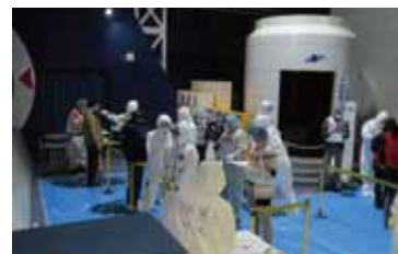
避難退域時検査訓練