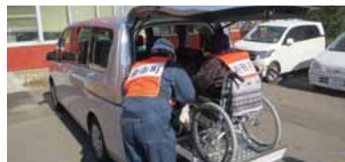
要配慮者避難訓練