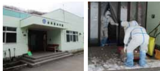
放射線防護対策施設運営訓練