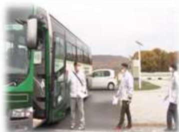
住民避難訓練 (バスによる避難)