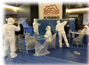
原子力災害医療活動訓練 (避難退域時検査)