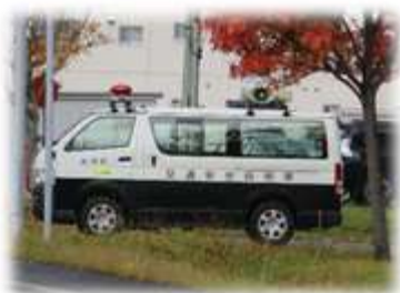
広報訓練 (広報車による広報)