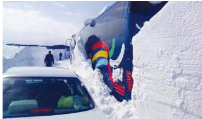
吹きだまりで立往生したバス 北見市常呂町(平成25年3月3日)

風は強いが晴れていると思ったら、雪を伴って一瞬で暴風雪に変わることもあるので、天気の変化には十分注意が必要です。