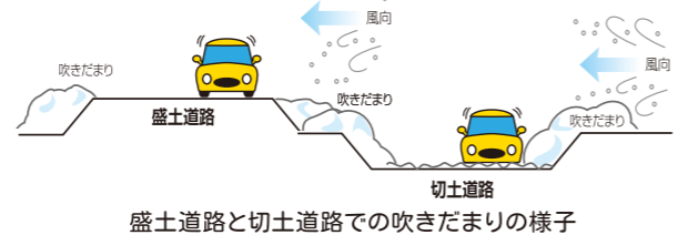
盛土道路と切土道路での吹きだまりの様子

● 道路の形状と吹きだまりの関係 道路には、まわりの土地よりも高い「盛土道路」と、低い「切土道路」があります。一般に、「盛土道路」に比べて「切土道路」では、吹きだまりが発生しやすい傾向にあります。