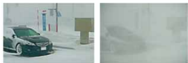
暴風雪で一瞬にして数メートル先が見えなくなる(右) 稚内市内(平成24年4月4日)