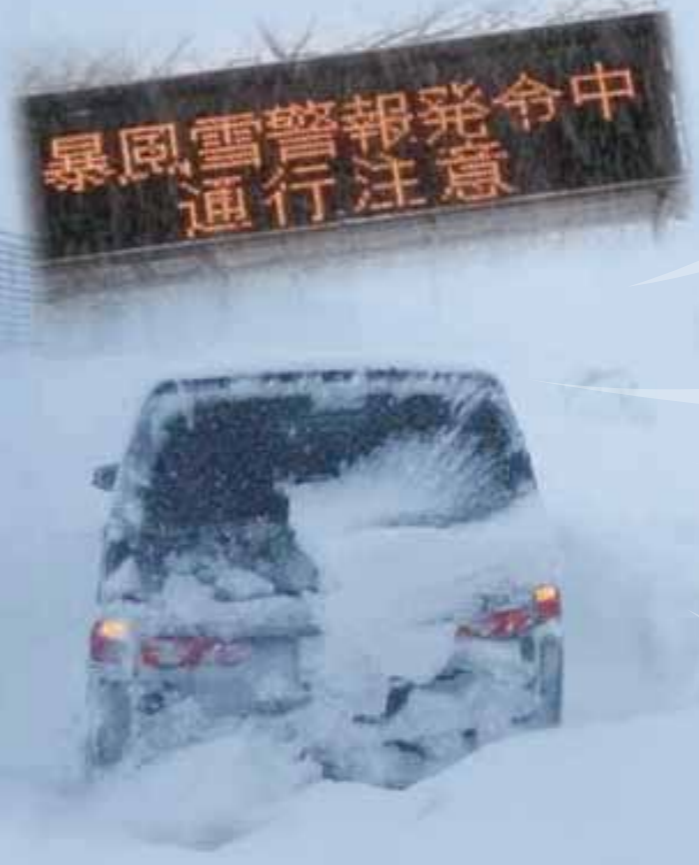
摩周湖~中標津 (平成25年1月27日)