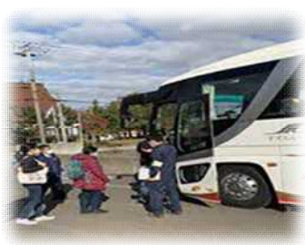
住民避難訓練 (バスによる避難)