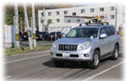
広報訓練 (広報車による広報)