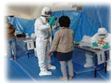
原子力災害医療活動訓練 (避難退域時検査)