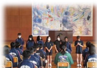
新人戦壮行会(バレーボール部)