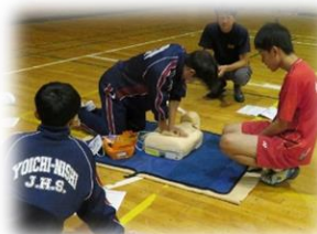
救急救命講習(3年生)