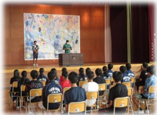
全道大会報告会(野球・卓球)