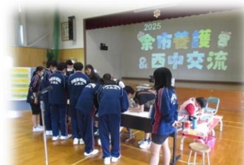
余市養護学校との交流会(1年生)