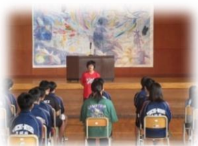
新人戦壮行会(バスケットボール部)