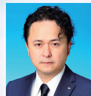
(一社)札幌青年会議所 理事長 平岸ハイヤー(株)専務取締役