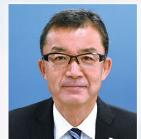
北海道ガス(株) 執行役員 スマートエネルギー推進部長