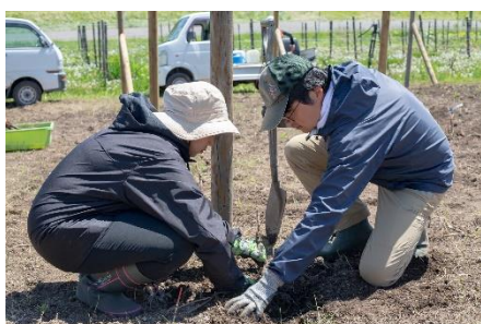
（余市ピースワイン・プロジェクト 新植イベント）