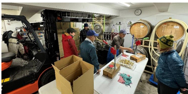
(山田堂の発泡酒瓶詰め作業)