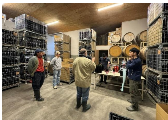
(10Rワイナリーで蠟付けとラベル貼り作業)