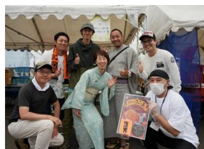
（北海ソーラン祭りの「地域 おこし協力隊と遊ぼう」出店 準備と対応）