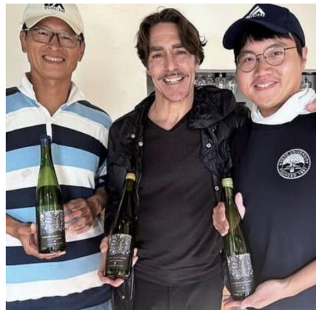
(ワイン業界の最高峰マスター・オブ・ワインMWのワイナリー案内)