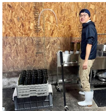
(登醸造の瓶詰め作業)