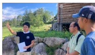
（おためし地域おこし協 力隊ツアーの案内・ワイ ン講座）