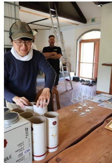
（外国ワインメーカー案内）