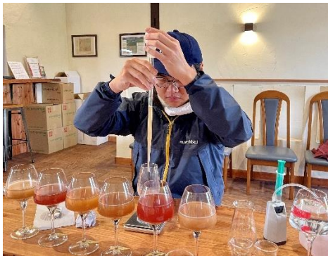
（果汁ブレンドと分析）

余市町登町のモンガク谷ワイナリーにて葡萄栽培とワイン醸造全般の研修と支援業務に年間を通して参加。20組以上の海外ワイン産業関係者（ノーマ、クリスティー、サザビーズオークションハウス、リーデル等）と観光客を案内。