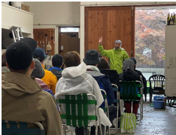
(ドメヌ・タカヒコ収穫の進行サポート)