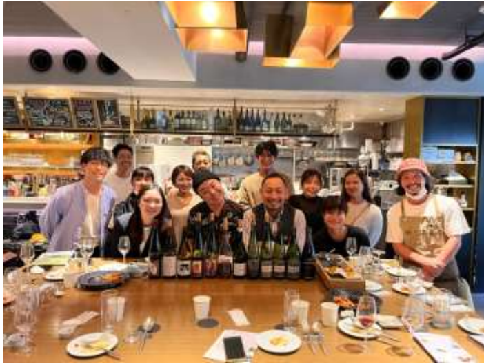
沖縄エステイトホテルイベント