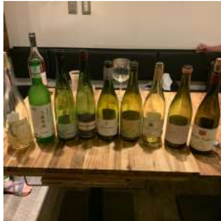
余市仁木ワインテイasting