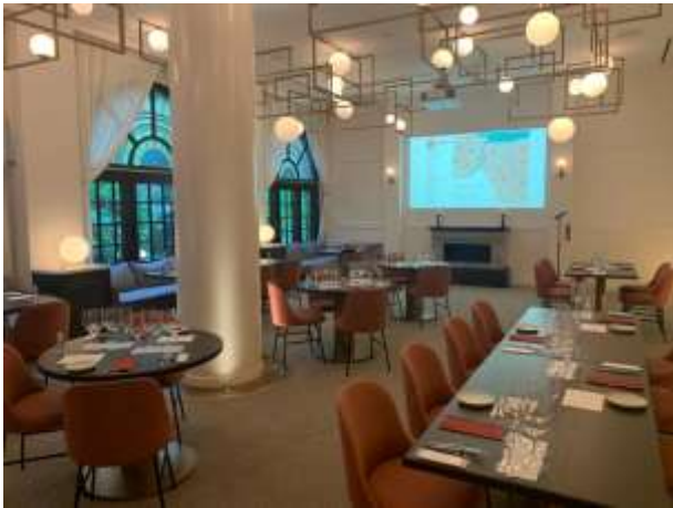
アンワインドホテル