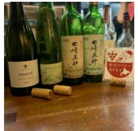
余市のワインあります