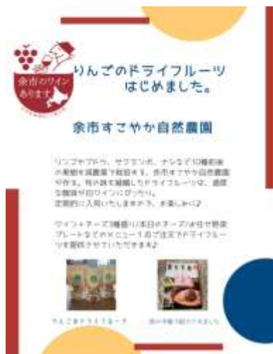
余市産りんごのドライフルーツ