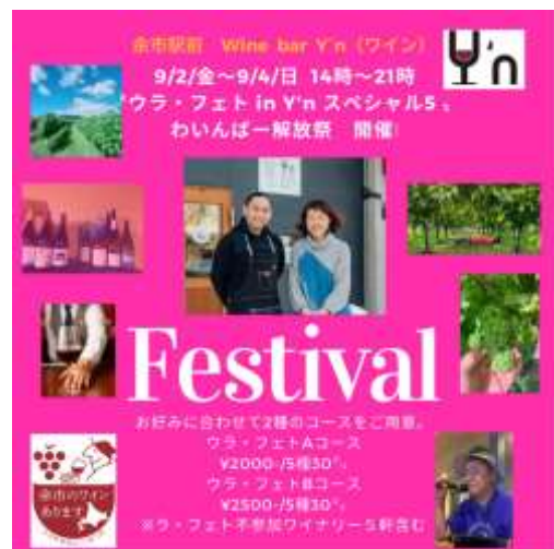
ウラ・フェトの会