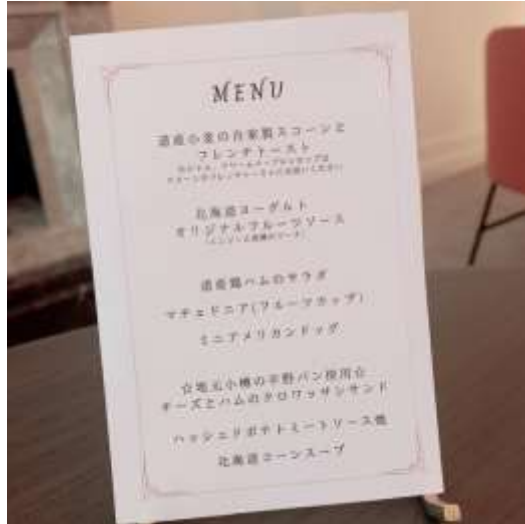
平川ワイナリーソムリエ'sディナーメニュー