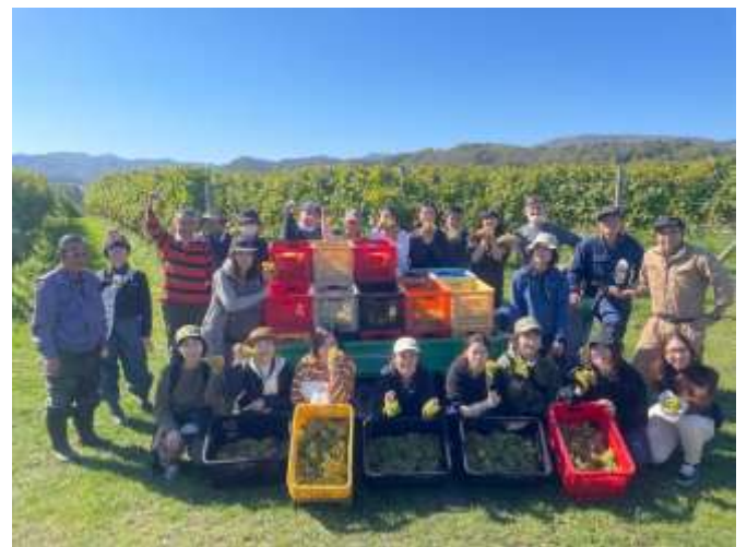
ワイン用ブドウ収穫