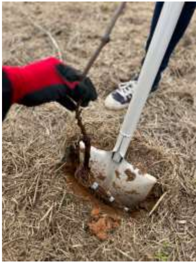
沖縄ブドウ苗植え