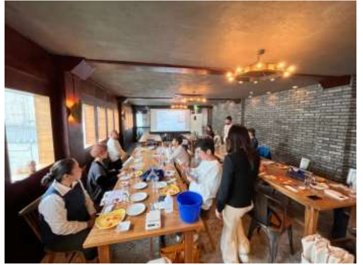
沖縄浮島ブルーイングイベント