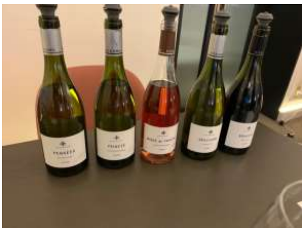
ワインラインナップ