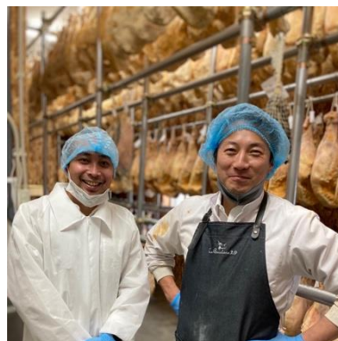
北一ミート社長商談