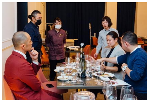
マリアージュの確認

(※3/10に予定していたが、蔓延防止措置延長に伴って延期が決定。6月頃を予定)