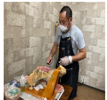
北島豚生ハム企画

(2) 町内のワイナリー「登醸造」からワインを作った後のブドウの搾りかすを提供していただき、町内のパン屋「パン処」にてブドウ酵母の特別なカンパーニュを作成。「ブドウ酵母のカンパーニュ」と「余市のワイン」のマリアージュを楽しんでもらった。