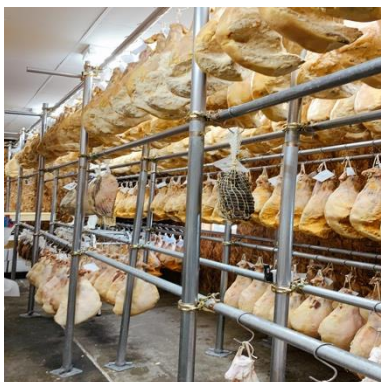
北島豚生ハム視察

(1) カネキタ北島農場のワインポークを加工、熟成させた原木の生ハム（札幌北一ミート加工）の商品を無償で提供。余市の生ハム×余市のワインのマリアージュを楽しんでもらった。