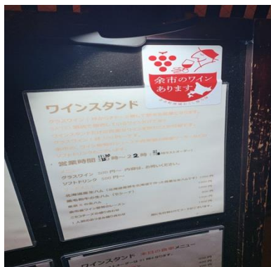
都内飲食店ステッカー