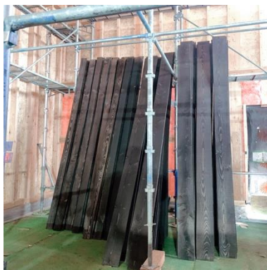
第二ワイナリー壁塗装