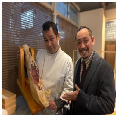
都内飲食店に北島豚導入

(※新型コロナウイルス感染症拡大に伴い、蔓延防止措置が終わらないため、イベントを延期中、世間でイベントが受け入れられるようになってきたら開催予定)