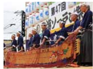
《第47回北海ソーラン祭り「お祭り広場」風景》

あわせて、ソーラン踊りの講習会を希望される団体(企業)は、実行委員会までご連絡ください。日程調整のうえ、個別に実施します。