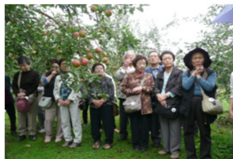
《「緋の衣」の原木見学》