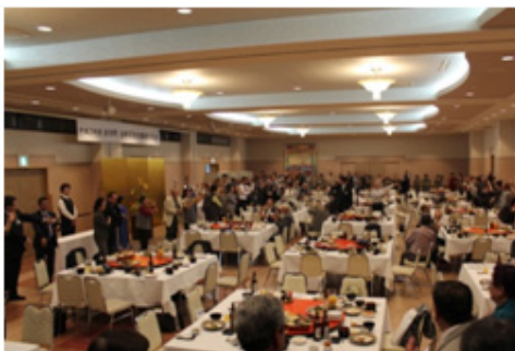
《全員で会津磐梯山踊り》

翌3日（月）、市民団の皆さんは旧会津藩士の墓、りんご「緋の衣」の原木を見学するなど、本町ゆかりの地をはじめ、様々な施設を巡りました。