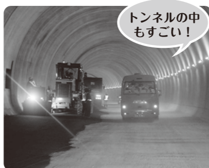
▲舗装工事が始まった天狗山トンネル