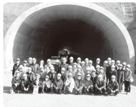
▲フゴッパトンネルにて記念撮影(午前の部)