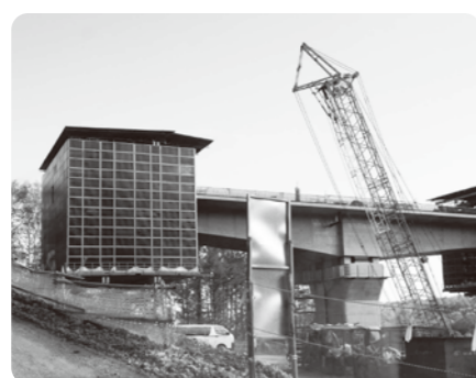
▲張出架設中の天神橋