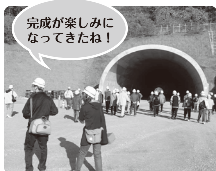
▲フゴッパトンネル余市側坑口付近