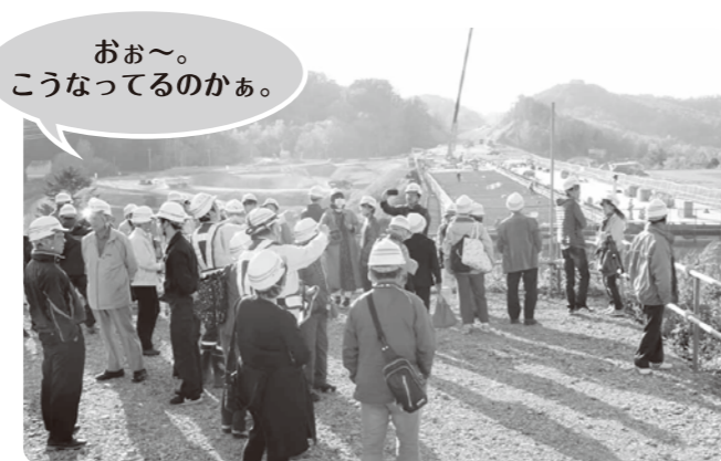
▲小樽塩谷IC付近(余市方向を望む)