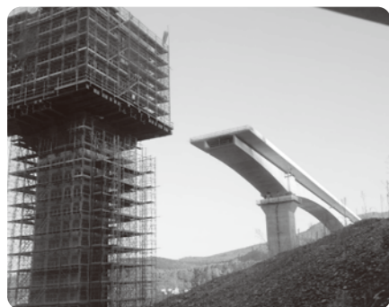
▲張出架設中の天神橋