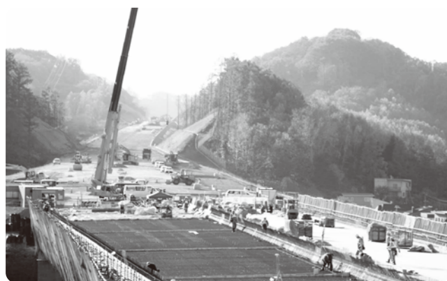
▲床版施工中の塩谷川橋