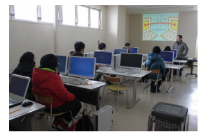
▲インターネット体験教室