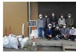
▲清掃活動を終えて