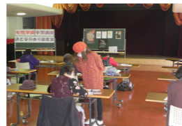
▲花や曼荼羅(まんだら)模様のぬり絵に挑戦！

6月20日(月)、女性学級第3回学習講座「大人のぬり絵教室」が行われ12名が参加しました。受講生は講師のKEI先生から美しい色使いや塗り方等の基本を教わり、色を塗るだけでなく模様や色彩のバランスを考えながら作品づくりに取り組みました。みんなで作品を鑑賞し合い、会話も弾んだ楽しい教室になりました。