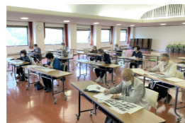
▲開校当時の写真を見て！