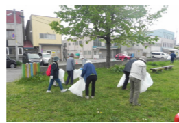
▲中央公園のゴミ拾い

5月23日(月)、女性学級の奉仕活動として第2回学習講座「公園の清掃」を行い、10名が参加しました。睦・中央公園内に落ちているゴミや枯れ枝を拾い集め、1時間ほどで用意したゴミ袋はいっぱいになりました。