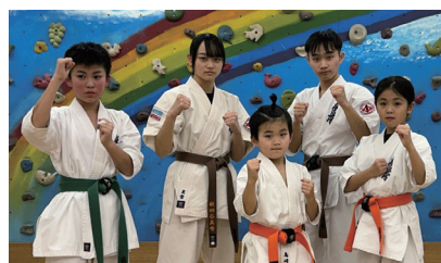
▲ 気合十分！目指すは日本一！