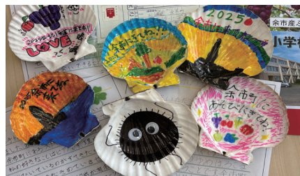
▲ みんなが作った貝殻郵便