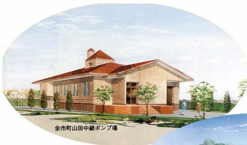
余市町山田中継ポンプ場