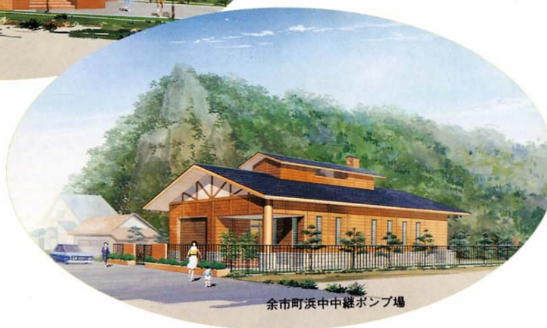
余市町浜中中継ポンプ場