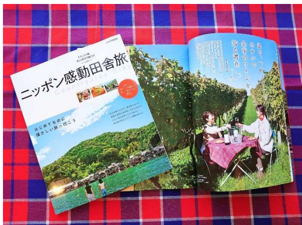
JTB ムック「ニッポン感動田舎旅」