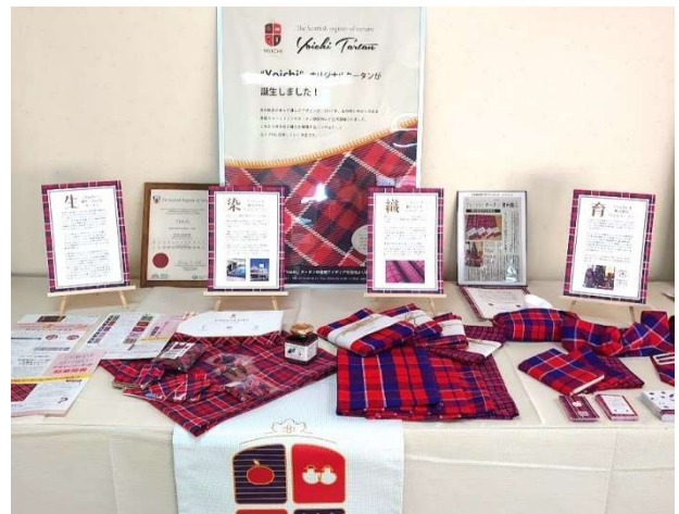
上：Yoichi タータンロゴマーク下：タータンサミット展示