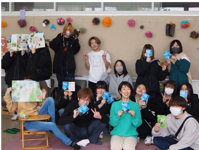
北星余市高校ボランティア局の皆さんと