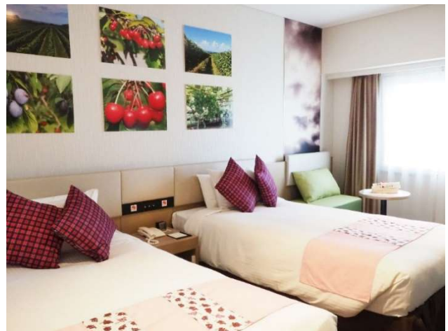
札幌東急 REI ホテルの余市コラボルーム

Yoichi タータンを地域ブランドとして継続的に育てるには町の人に愛着を持ってもらうこと、多くの人に手にとって頂ける商品を作り育てることを必須とし、事業者や町民の皆様に協力を仰ぎながら活動しました。商品化に際しては町の小規模事業者の仕事や利益が循環することを意識し、町内のハンドメイド作家や社会福祉施設等と一緒に開発を進めています。例えば余市養護学校とコラボレーションした「蜜蝋ラップ」の売上の一部を学校に寄付する仕組み作りなど、Yoichi タータンを介して産地、売り手、買い手、作り手の環境も向上するよう工夫しています。