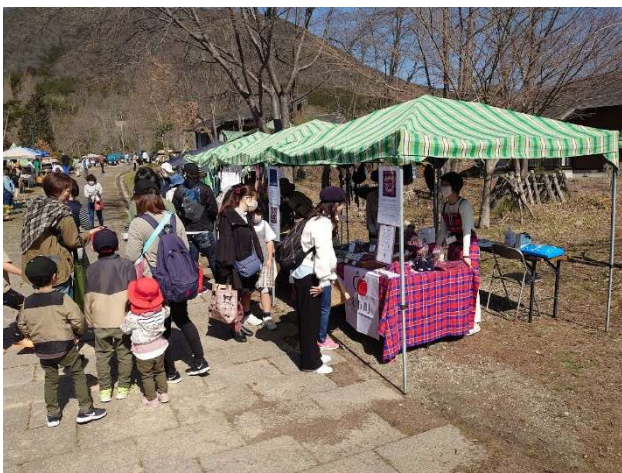
第2回 タータンサミット in 多可でのマルシェ販売

令和4年3月開催の「タータンサミット in 多可」への参加を契機に兵庫県の地場産業、播州織の産地で町独自のタータン「タカタータン」をもつ多可町と交流がスタート。観光協会がスコットランドタータン登記所に登録した「Yoichi タータン」を播州織で制作するプロジェクトを立ち上げ、生地制作と販売、商品開発、コンテンツデザイン、販促ツール作成、PR等のブランディングを行っています。播州織タータン生地の売上は207,500円(96m。R4.12.2販売開始～R5.3.26)。今年度もサミットに参加し、資料展示やマルシェ販売、生地の追加発注や商品開発の情報収集を行ったほか、タータン関係者と交流を深めました。