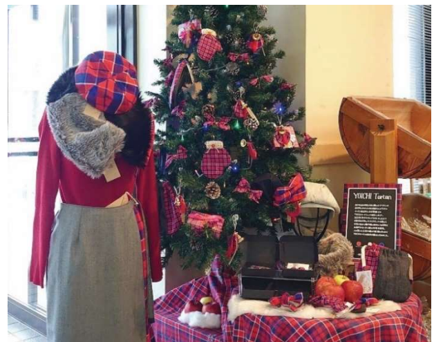
播州織タータンの服飾雑貨