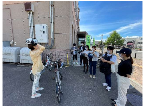
科学大学学生との試走