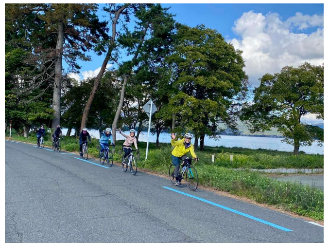
ビワイチ研修（滋賀県）

また、札幌市の北海道科学大学 未来デザイン学部のゼミがアウトドアスポーツメーカー（株）シマノ主催の『散走×ソーシャル』をテーマとした全国企画コンペのフィールドとして余市町を選定。サイクリングルート案内と取材先アレンジを行いました。結果として2チームが企画に応募し、うち1チームが大賞を受賞。余市の人の魅力を伝え、来訪者と町の人が交流するという企画内容の実現に向け、次年度も協力体制を維持します。