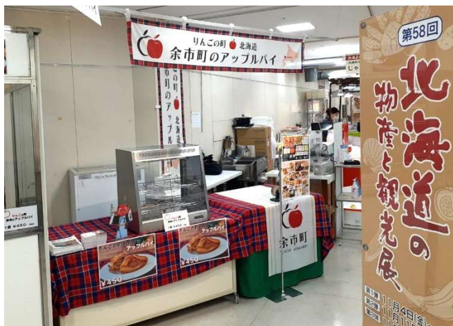
鹿児島山形屋 アップルパイ展示場に設置したPR ツール