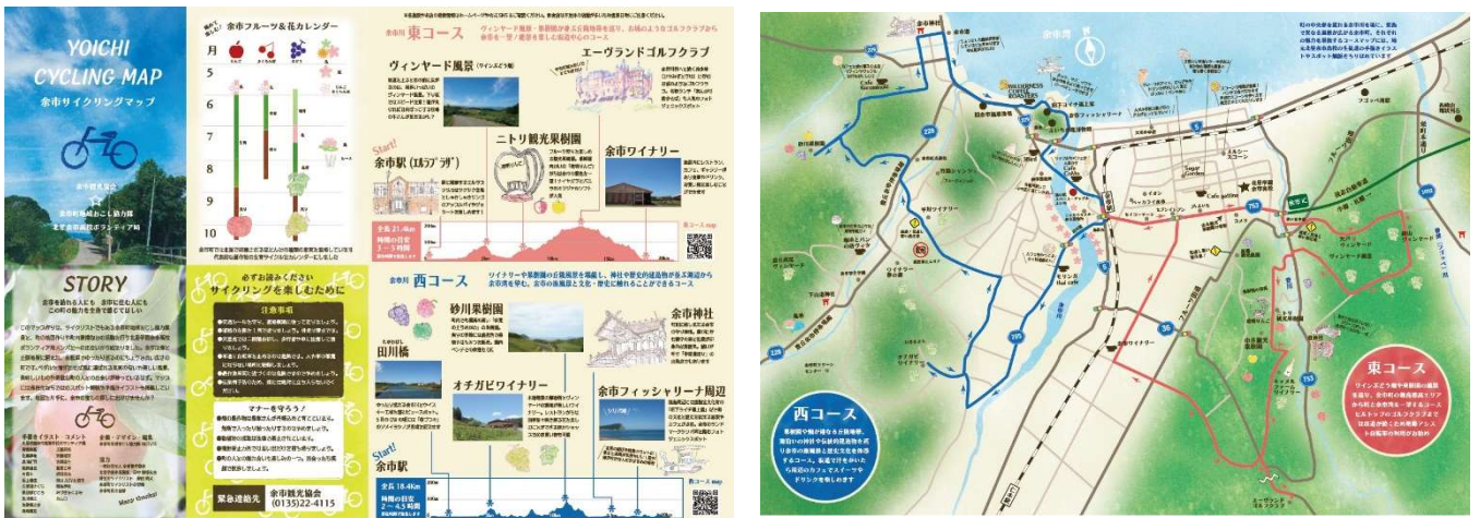
余市サイクリングマップ

自転車を観光に活用するサイクルツーリズムの契機として、サイクリングマップを制作しました。サイクルツーリズム先進地である滋賀県等で研修を受けたほか道内の事例収集も行いました。マップ制作では余市川を中心に東西の地勢や歴史文化の魅力を堪能するサイクリングコースを検証、関係者及び関係施設にマップ制作の説明をかさね、理解と協力を頂いた上でコース設定し「余市サイクリングマップ」をデザイン制作しました。制作にあたり町内のサイクリスト、北星余市高校ボランティア局の生徒達に協力を頂き、高校生ならではのコメントやイラストを盛り込みました。Google map 上にルートを設定、最新情報や利用者の声を随時反映し、改良版マップの作成に繋がります。