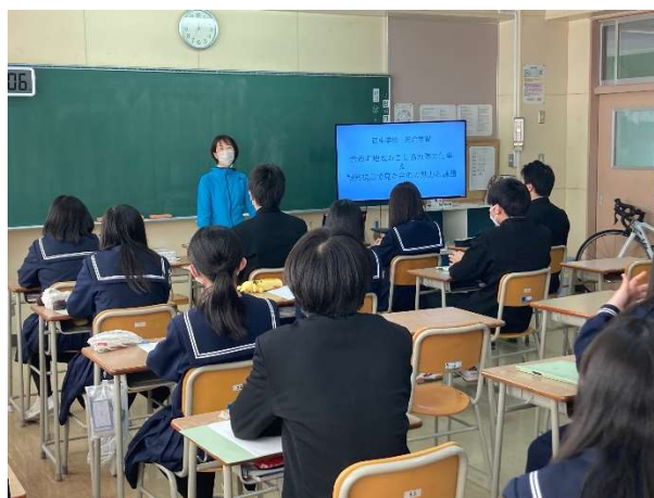
西中学校 総合学習