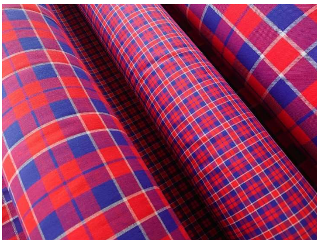
播州織 Yoichi タータン生地

Yoichi タータンを地域ブランドとして継続的に育てるには町の人に愛着を持ってもらうこと、多くの人に手にとって頂ける商品を作り育てることを必須とし、事業者や町民の皆様に協力を仰ぎながら活動しました。商品化に際しては町の小規模事業者の仕事や利益が循環することを意識し、町内のハンドメイド作家や社会福祉施設等と一緒に開発を進めています。例えば余市養護学校とコラボレーションした「蜜蝋ラップ」の売上の一部を学校に寄付する仕組み作りなど、Yoichi タータンを介して産地、売り手、買い手、作り手の環境も向上するよう工夫しています。