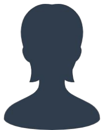
現役隊員の声その1

私たちが日常的にサポートしてくれる役場職員の皆さんは、こちらの問い合わせで分からない時があっても、すぐに調べて回答いただくので、 私たちが活動しやすいよう努力 してくれていると感じます！