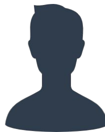
現役隊員の声その2

私たちが日常的にサポートしてくれる役場職員の皆さんは、こちらの問い合わせで分からない時があっても、すぐに調べて回答いただくので、 私たちが活動しやすいよう努力 してくれていると感じます！