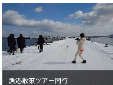
漁港散策ツアー同行