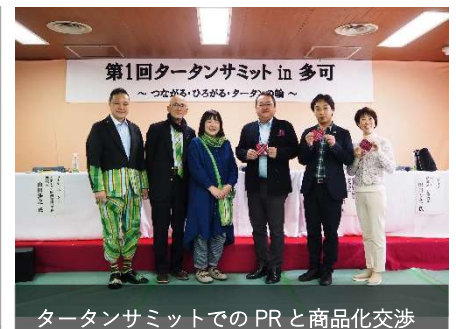
タータンサミットでのPRと商品化交渉