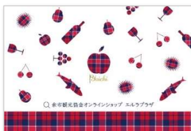
余市観光協会オンラインショップ エルラプラザ

オンラインストアのPR はがき(上)、地域おこし協力隊座談会パンフ(下)など、印刷物のデザインを手がけました。