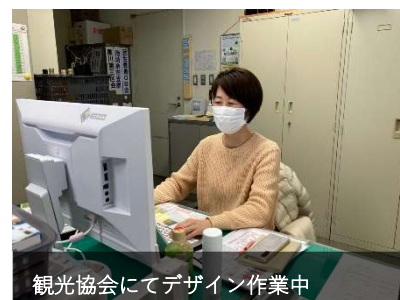
観光協会にてデザイン作業中