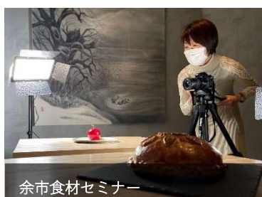
余市食材セミナー