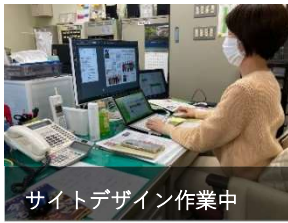
サイトデザイン作業中