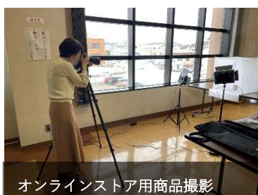
オンラインストア用商品撮影